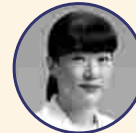
すいしょう [水晶] 院長

大邱達西区月背路39ギル26 KCCスウィチェン商店街2階 +82-53-641-0098 anais2000@hanmail.net